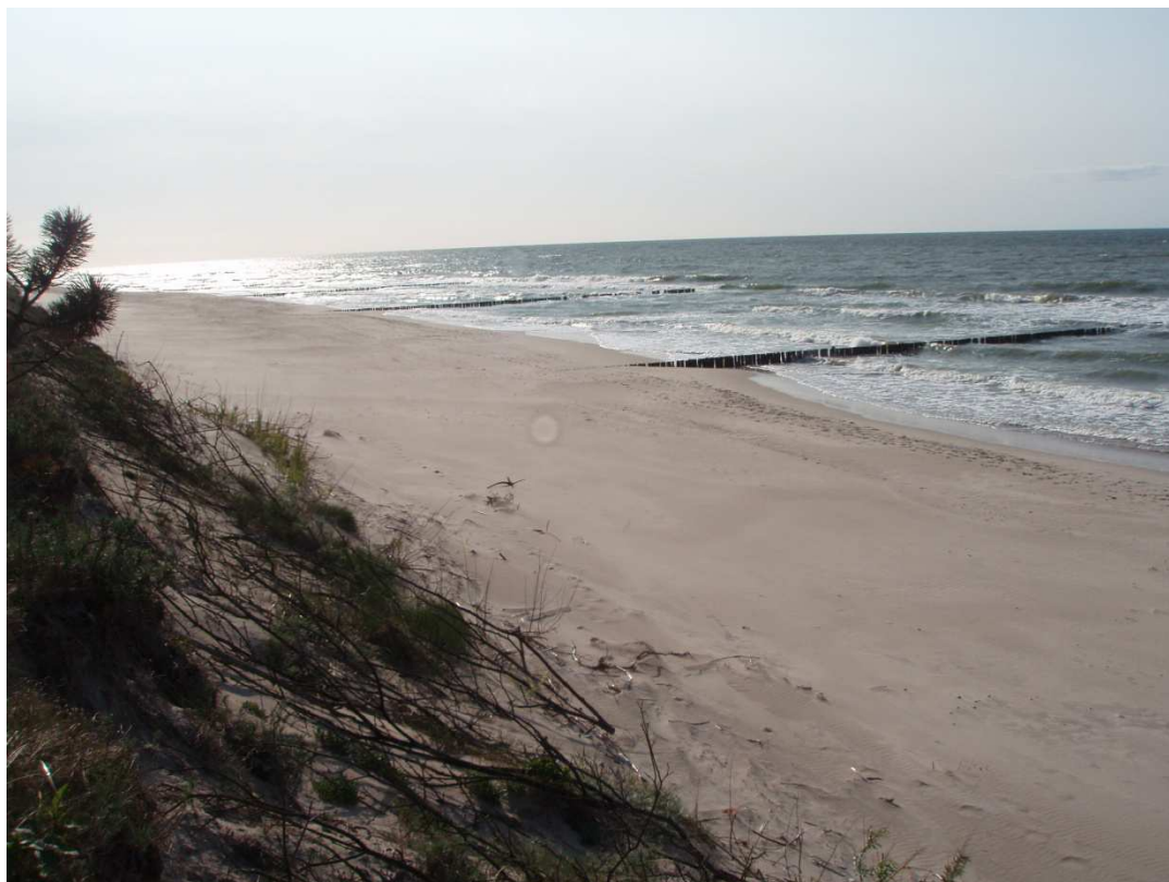
Zdj.19 Brzeg morza w okolicach Sarbinowa