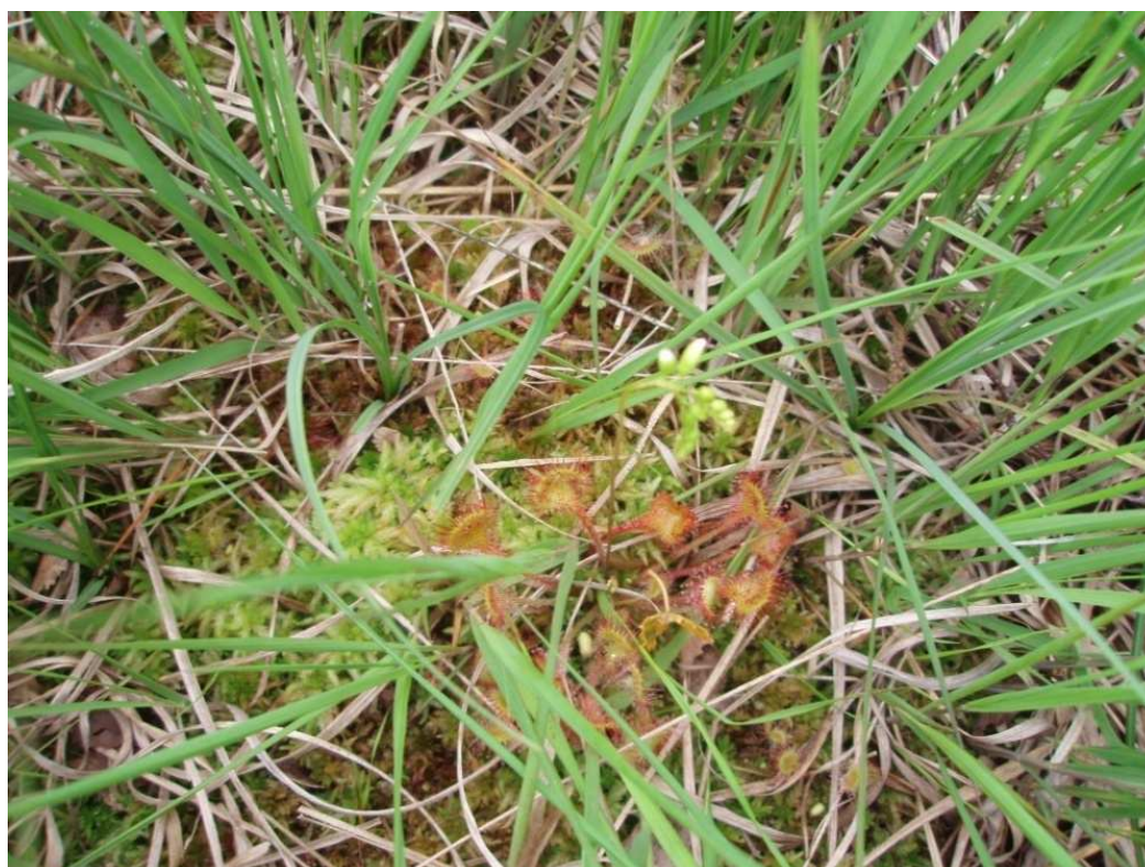
Zdj.2 Rosiczka okrągłolistna - Łazowskie Bagna