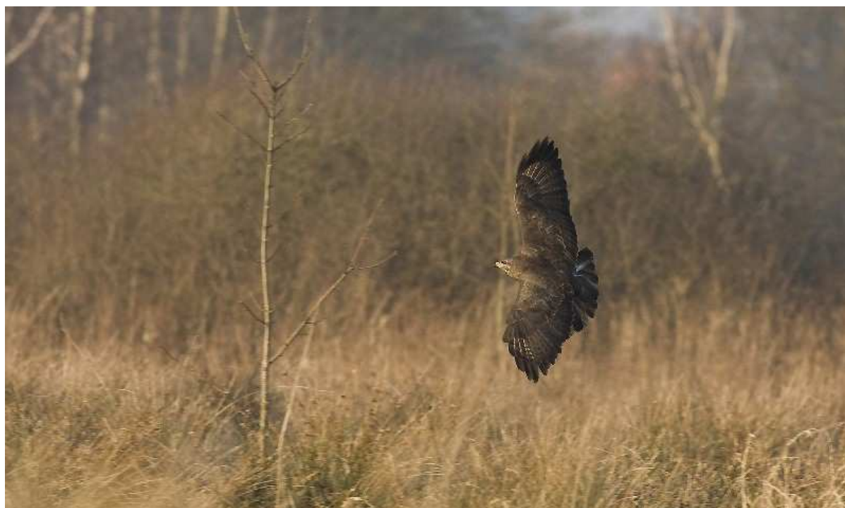
Zdj.9 Myszołów – okolice Łaz