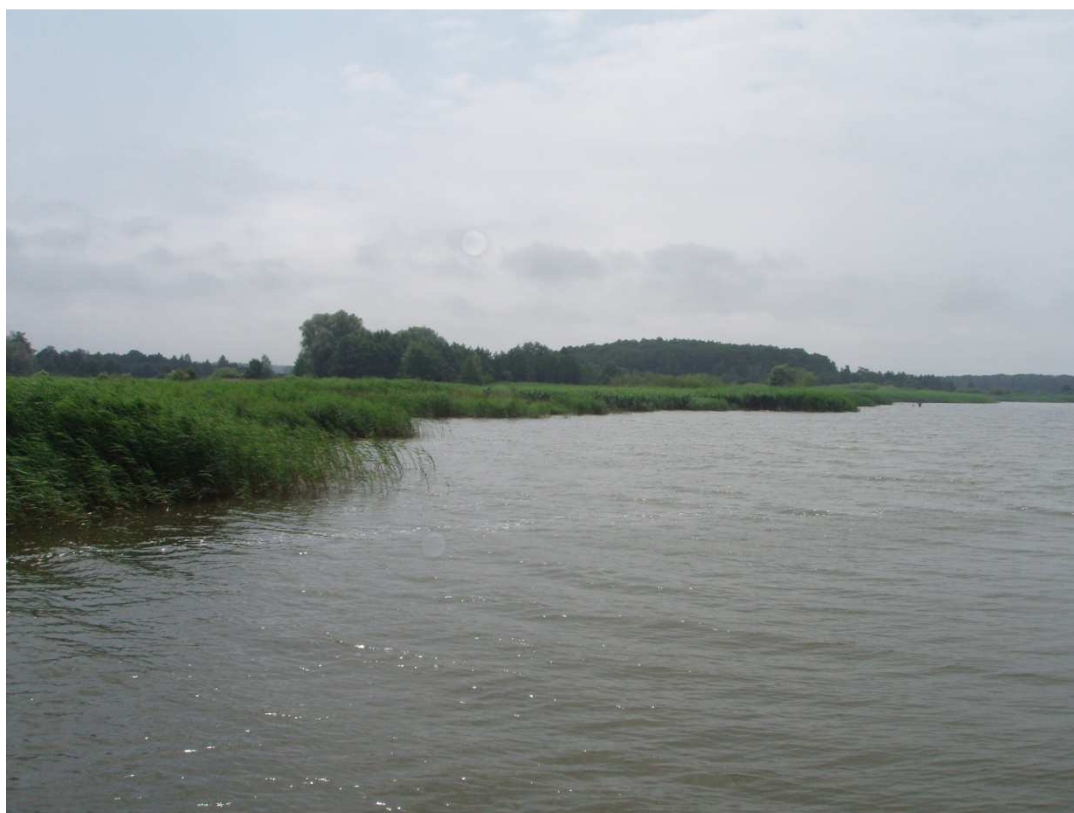
Zdj.19 Brzeg jeziora Jamno