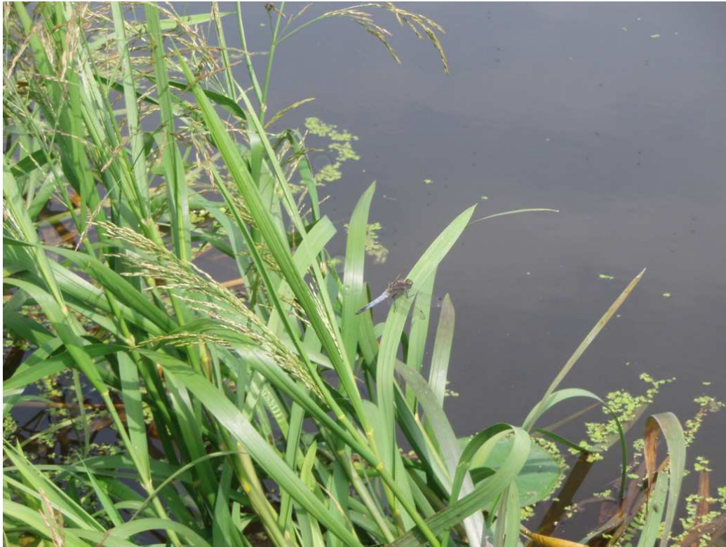
Zdj.5 Lecicha pospolita – teren obszaru cennego przyrodniczo koło Gąsek - OC-1