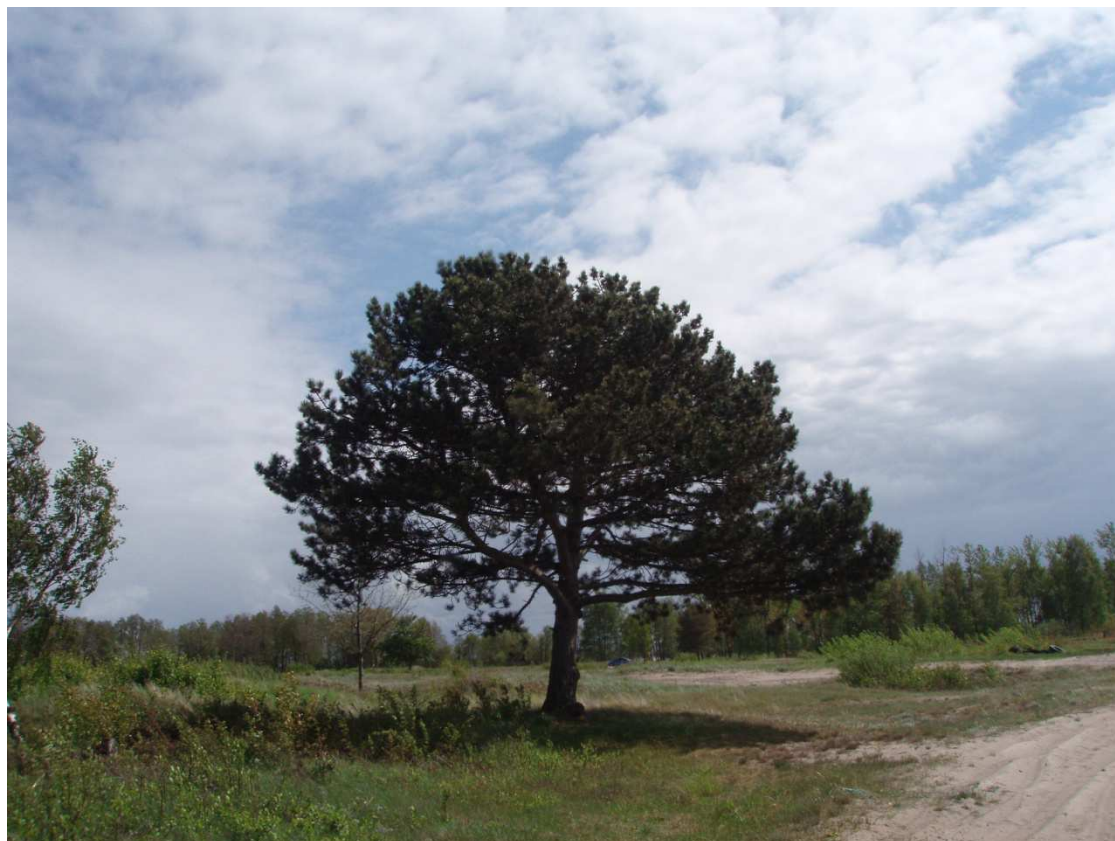
Zdj.15 Sosna pospolita – mierzeja w okolicach Unieścia