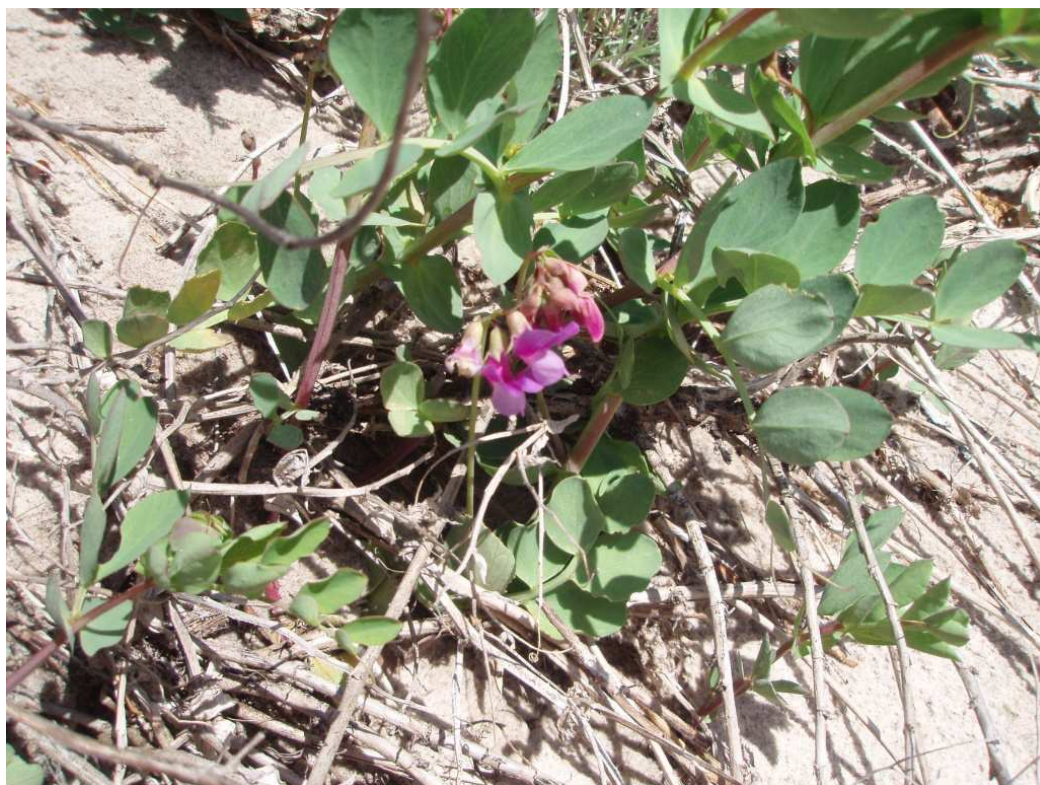
Zdj.14 Groszek nadmorski - wydmy za Unieściem w stronę Łaz