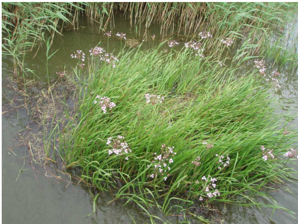
Zdj.13 Łączęń baldaszkowy – jezioro Jamno (Podamirowo)