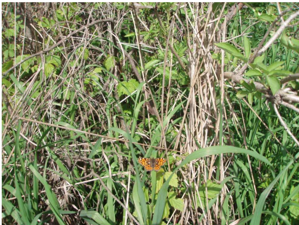
Zdj.4 Rusalka kratkowiec – okolice Gąsek