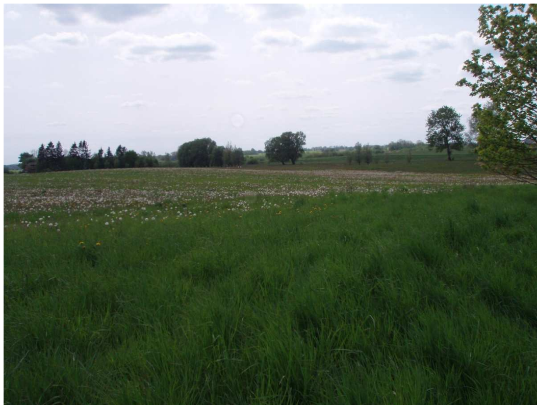
Zdj.17 Łąki - obszar cenny przyrodniczo OC-4 – okolice Niegoszczy