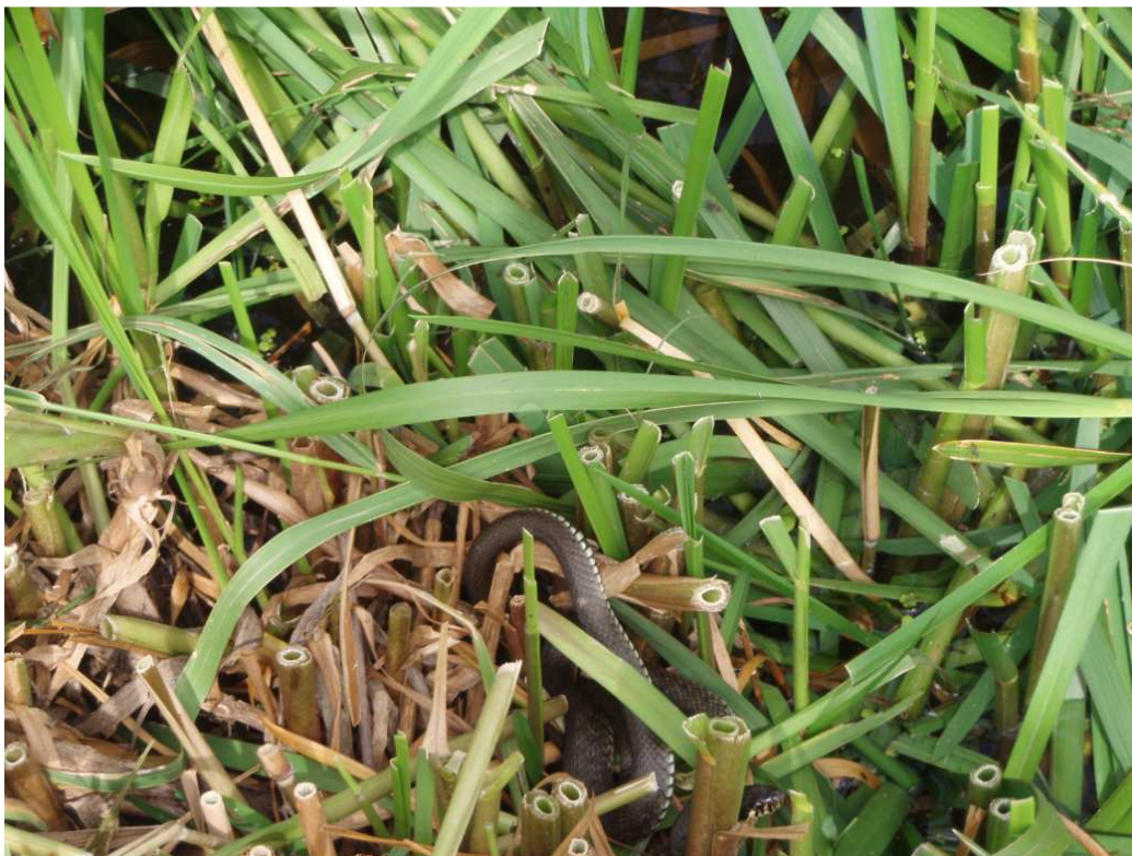
Zdj.6 Zaskroniec – strefa brzegowa jeziora Jamno