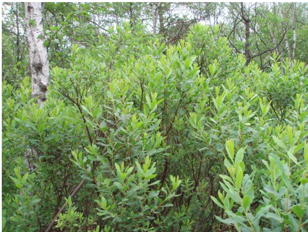
Zdj.3 Zespół Myrico-Salicetum auritea – Bagna Łazowskie