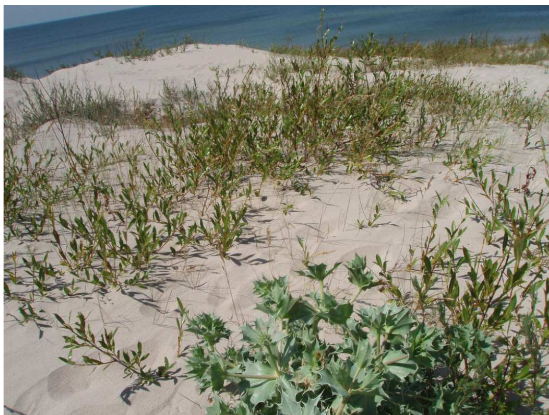
Zdj.12 Mikołajek nadmorski – wydmy za Unieściem w stronę Łaz ((fot. Zuzanna Szuliga-Król)