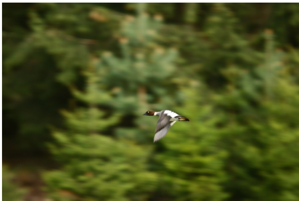
Zdj.7 Gągoł – brzeg Bałtyku, Łazy