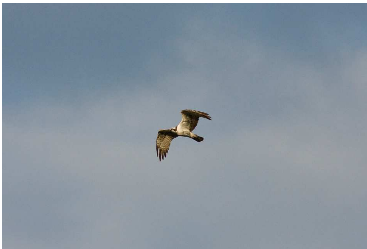
Zdj.10 Rybołów – Jezioro Jamno okolice wsi Osiek