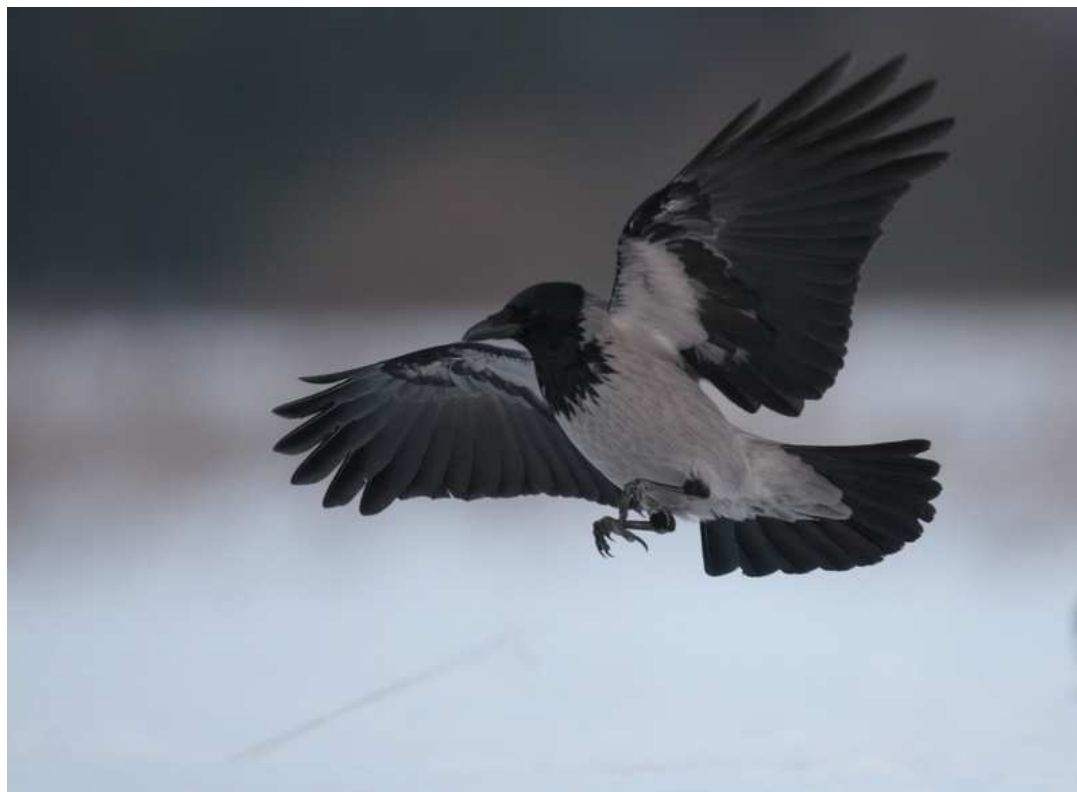
Zdj.11 Wrona siwa – Mielno (fot. Rafał Rudzin)