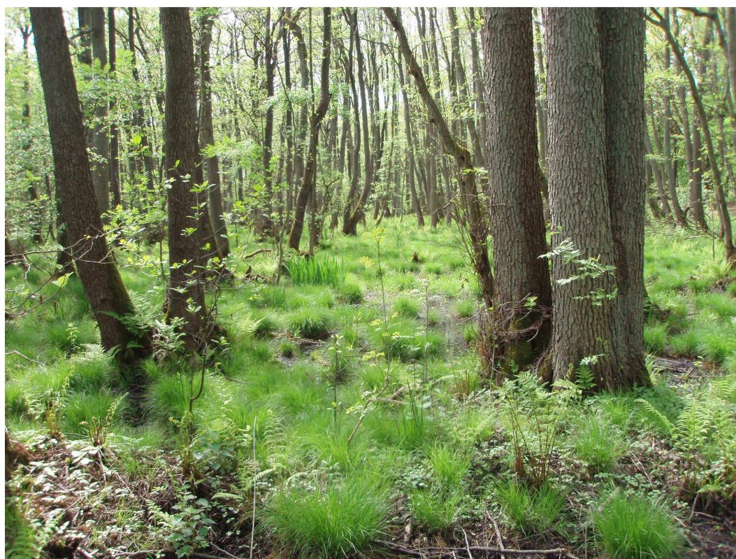
Zdj.18 Kompleks leśny „Łazowskie bagna”