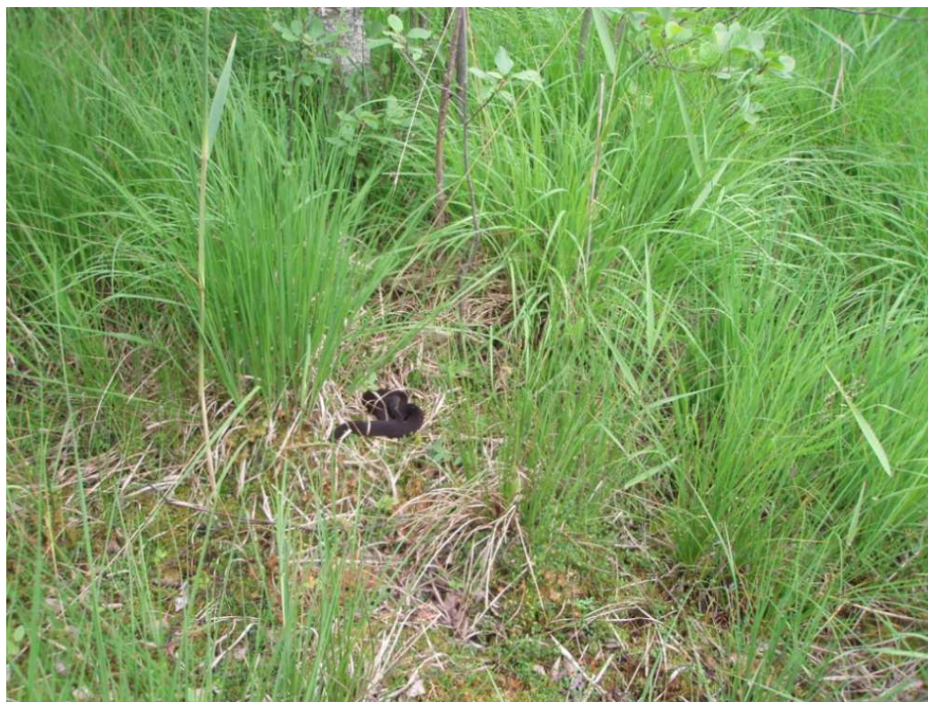
Zdj.1 Żmija zygzakowata – Łazowskie Bagna